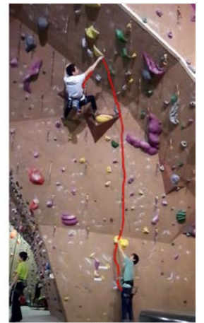
リード(ロープをかけながら登ります。)