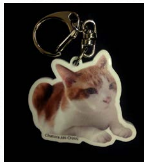
▲完成したキーホルダー

難易度はお願いする業者さんにもよります。今回はフォトショ入稿が可能な所を選んであります。そんな高いソフト無い！って場合は、PNG 画像入稿のところもあります。たまたま白アクリルが選べる業者さんだったので白にしてみました。とても可愛くできたのでオススメです！