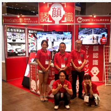
▲エイコムブースの前で

また、導入に向けての様々な実証実験を行っているところですので、製品への量産化へはまだ時間がかかるところですが、当社オリジナルの50インチの顔認識機能付きのデジタルサイネージ機をはじめ、STBやタブレットでのデモンストレーションはいつでも可能ですので、お気軽にお声を掛けてください。