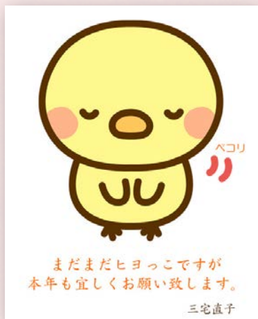
映像チーム 三宅 直子