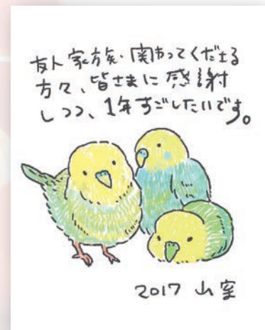
WEBチーム 山室 亜耶