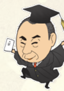
3月アカデミックドレス