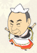
4月スイス民族衣装