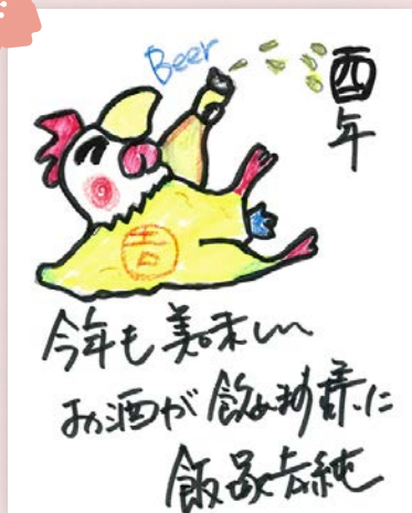
代表 飯塚 吉純