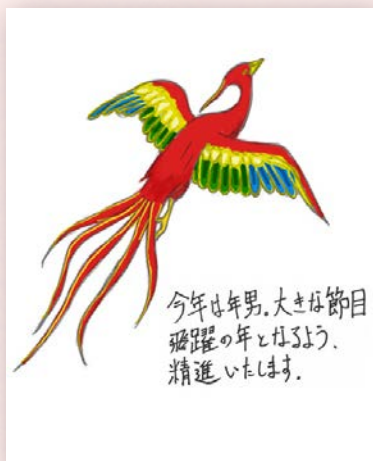
WEBチーム 鮎川 絢一