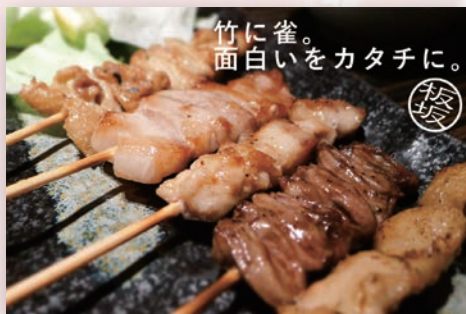
映像仕事人 板坂 勇児