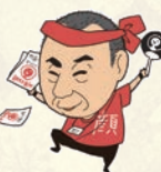
10月イベントスタッフ